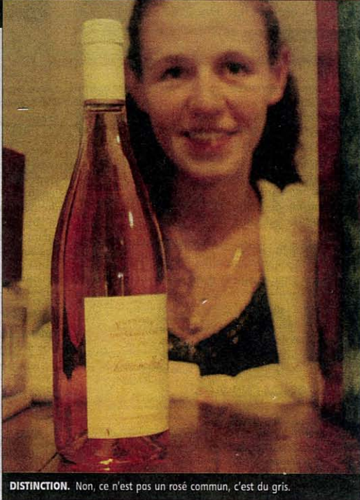
DISTINCTION. Non, ce n'est pas un rosé commun, c'est du gris.

Qu'est-ce que le vin gris ? Il a l'apparence, la couleur du rosé (en plus pâle), mais ce n'est pas du rosé. Il s'agit en fait d'un vin fait à partir de cépages rouges (pinot et gamay notamment) mais travaillé en pressurage direct comme le vin blanc. Le moût (le jus) fermente directement sans macération avec les raisins. Le vin gris repose sur une technique de vinification et doit donc être distingué du rosé issu du pinot gris, comme celui de l'appellation reuilly.